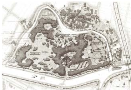
圖8. 宜蘭縣礁溪鄉淇武蘭遺址公園整體規劃平面圖