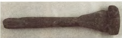
圖24. 槳把。

5-3 槳把，長25.2cm、寬6.4cm、厚2.5cm，出土於IT6P3D L2。為船槳柄部把手部位殘件，把呈三角形，結東端為圓弧狀凸起利於持握，上下把面皆刻有爪形記號（圖24）。