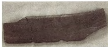
圖21. 刀形打緯棒。

4-2 刀形打緯板，長25.9cm、寬7cm、厚1.6cm，出土於IT4P4B L4。刀形，扁長，半殘，背部雕刻幾何文飾，另一側端削斜凹，製作精細。推測可能是刀形打緯板的殘件，利用時是以手持握刀形打緯板的背部，將穿過經線的緯線向已織就完成近身的布塊打緊，是水平背帶式織具的組件之一（圖21）。