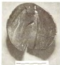
圖7.椰殼碗。