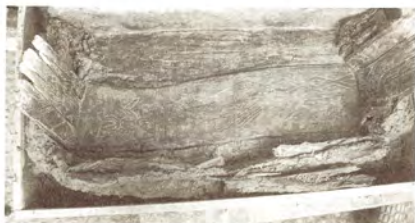
圖3.長82.5cm、寬34cm、厚0.5-1.8cm。M080的底板、南北端板皆有雕刻紋，其中底板即為本文介紹之雕板B。

出土時作葬具使用為M080底板（圖3、4），與M080南北端板的雕刻線形、紋樣、材質皆相近，推測是同一組功能的木雕板。依據伊能嘉矩在宜蘭的實查紀錄，取得木雕板是做為作壁板用（伊能嘉矩1897），而M080底板兩端有穿孔，推測本件木雕板原來也是作為牆板或門板使用，後來取下再利用為棺板。觀察紋飾，底板圖樣周圍雕有結束邊線較為完整，南北端板為局部圖樣，後者應只取用牆板的局部。