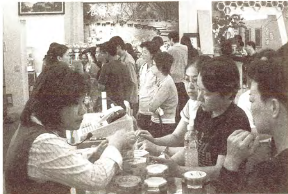
圖2. 親切的服務態度，使蜂采館的業績蒸蒸日上。

進到館內後，首先看到的是蜂產品的銷售展示區，但是這並非館內導覽參觀的第一站。跟著導覽人員的腳步，遊客首先來到位於二樓的資訊簡報區，透過簡短影片介紹蜂采館與蜂產品的由來及蜜蜂的種種習性等，對蜂采館與蜜蜂生態有一些初步的認識與了解。接著，回到一樓穿過蜂產品的銷售展示區，來到靜態展覽區，展場中系統化、有趣的解說展版、標本物件與活體的展示，加上導覽人員對展示主題內容的娓娓道來，彷彿塑造了一個充滿活潑