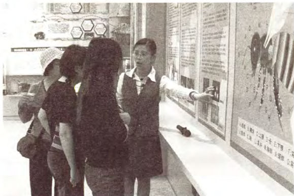
圖3. 導覽服務人員向遊客解說蜂蜜的生態。