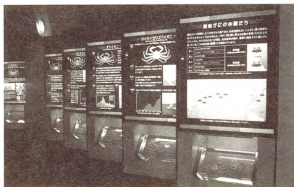
圖6.可以翻轉的螃蟹展示區

11月7日離開了河鹿莊前往越前蟹博物館，本館位於福井縣丹生郡，2000年7月15日正式開館，總工程費20億990萬日元。本館設立的目的為具體展現本町特產「越前蟹」，並收集展示各種甲殼類動物。越前地區在1990年代時有150萬的遊客數，2002年只剩60萬人，因此本館的