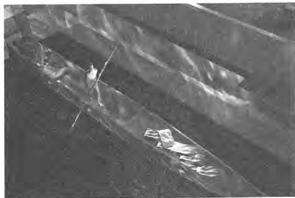
駁船為西門渡口場景的一部份，船上裝載著從宜蘭河上游運往西門的貨物，當觀眾靠近此處，可聽見老船夫的話語。

圍繞著駁船也有許多故事。為了讓觀眾瞭解平日黑色的船身到了端午節便彩繪為龍舟，特地設計了一面鏡子，當觀眾走至此處角度正好從鏡子的反射看到色彩鮮麗的船身。