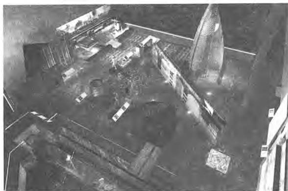
西門渡口場景，由人像、物件、聲音、燈光組合的劇場舞台。

海運進出口貨的雜貨店、打鐵店為代表。在每個仿當時西門商街建築意象的拱門下，背景為各店面的影像輸出以及圖文說明，前景為真實物件，例如打鐵店慣常在店前擺置之掛滿鐵製工具的展示架；米店前擺置當年裝米的麻袋、米斗，並以當年日日新報的報導說明宜蘭米的重要。以上處理歷史的展示方式，以文物、影像裝置的某種「場景」，透過影像、人模和物件等符號之間的關連，交織出的意義端視觀者從什麼角度來詮釋。在此，博物館展示提供開放性地從不同角度詮釋這些物件的思考空間，對比於展場內帶有劇情的錄音或圖文說明版對歷史的詮釋，更豐富了歷史的思考。