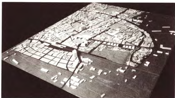
羅東林場帶動起羅東鎮的城市發展(羅東鎮全鎮模型)

隨著產業的變遷與城市經濟的發展，某些具有歷史價值的建物與場所失去了舊有的機能與活動，成為都市中的閒置空間，但其曾在城市的發展史上或居民的記憶中所扮演過的重要地位。從今日的社會狀態來思考歷史建物的再利用上，必然需將建物新的活動連接在今日的社會脈動中，並藉由創意的空間使用提案，創造永續發展的機制，以能為城市與居民帶來新的發展契機，同時需承載舊有歷史記憶，建構城市居民的自明性與地方感。