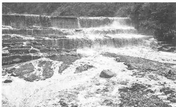
圖2 1986年9月艾貝颱風大同鄉瑪崙溪攔砂壩之災情