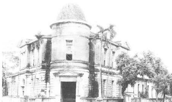
圖1 宜蘭市清水路宜蘭水利委員會全景