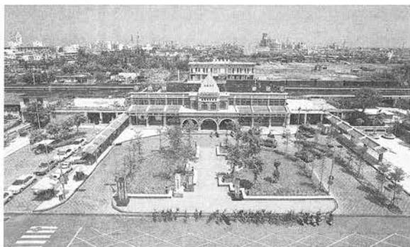
圖4 俯瞰宜蘭市台灣鐵路局宜蘭站