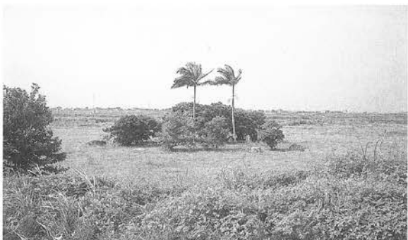
圖1 五結鄉鎮安村渡船口遺址

由陳財發先生自1980年代起所拍攝宜蘭縣境內各重要古蹟與歷史建築，藉由主題性的拍攝紀錄，輔助後人了解宜蘭歷史人文發展等相