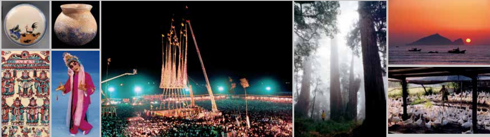
Lần lượt từ trên, trái qua phải Đĩa cổ hình gà trống màu sắc sặc sỡ Chum vajra gốm có hoa văn Cổ vật được khai quật ở di tích Qiwan Cướp đồ cúng Toucheng Rừng bách ở núi Loulan Đảo Guishan

Các lễ hội dân gian quan trọng của Đài Loan như cướp đồ cúng của huyện Toucheng, đua thuyền rồng của xã Qiaoxi, rước kiệu thần phật ở Wujie. Lễ hội cướp đồ cúng ở Toucheng là lễ hội lớn nhất ở Đài Loan, tổ chức vào chiều ngày cuối cùng tháng 7 âm lịch, vừa là lễ hội tôn giáo dân gian vừa là cuộc so tài, đã trở thành hoạt động dân gian của Đài Loan được thế giới biết đến. Đua thuyền rồng ở Qiaoxi không nhằm mục đích thắng thua, đây là một trong 10 lễ hội dân gian của Đài Loan. Rước kiệu thần phật tổ chức vào tết nguyên tiêu âm lịch, do đền chùa địa phương tổ chức rước kiệu thần phật trên đường phố cổ, đi qua lò lửa, người dân tin rằng tập tục này có thể đem lại bình an và được lưu truyền đến ngày nay.