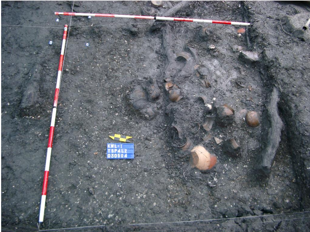
出土大量陶罐現象