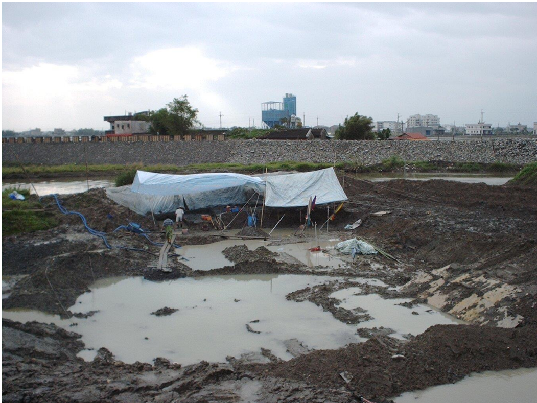
2002 年淇武蘭遺址考古搶救發掘現場