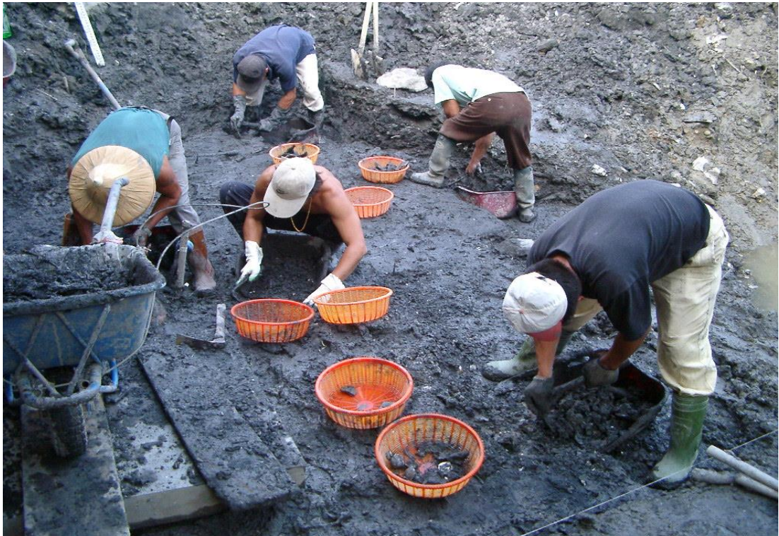
2002 年淇武蘭遺址考古搶救發掘現場