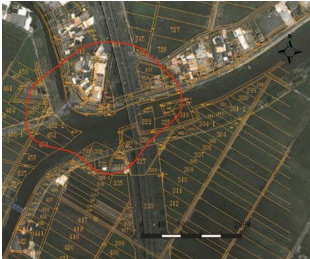
淇武蘭遺址位於礁溪鄉二龍河畔預測範圍圖

1648年荷蘭所進行的戶口調查中，淇武蘭為台灣中北部最大的原住民聚落，出土的遺物、生態遺留與現象都非常豐富，可見漁獵、採貝、耕種、住杆欄屋、行屈肢葬，自製陶罐、木碗、木槳等器物，他們在木板和骨角上雕刻，除了進口陶瓷器、銅錢、玻璃珠、瑪瑙珠等等大量舶來品之外，還趕上抽煙斗的世界流行風，各類生活器物十分精采豐富，為金屬器時代的重要遺址。