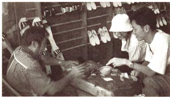
現場量製合腳的木屐（白米木屐村）