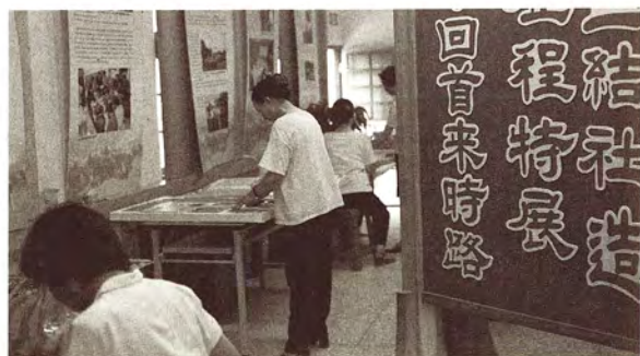
融入社區生活之中（二結庄生活文化館）