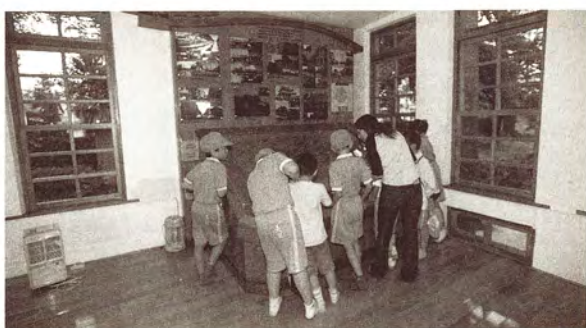
學童參觀活動（設治紀念館）