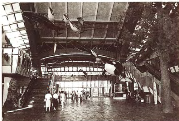
國立海洋生物博物館大廳

國立海洋生物博物館全館分為台灣水域館、珊瑚王國及世界水域館。一進大廳，天花板下吊著一些鯨豚模型，頭向內，一隻接一隻成群地穿過川堂向著大海，分別向著右邊的珊瑚王國，及左邊的台灣水域。我們隨著導覽人員，觀看高山溪流、水庫、牡蠣養殖、河口區、潮間帶、珊瑚礁、探索魚類、大洋池和兒童探索區等，完整呈現台灣本島及附近水域的生態。而珊瑚王國，是以南中國海絢麗色彩之熱帶珊瑚區域為故事主軸，包括珊瑚礁預覽區及令人讚歎長達84公尺的海底隧道與沉船探險。鯊魚池看台也很吸引人，尤其以隔著寬16公尺、厚30.3公分、價值3500萬的大水族館看鯊魚秀，更是高潮。另外，世界水域館預計2006年與大家見面，屆時當會是個大賣點。