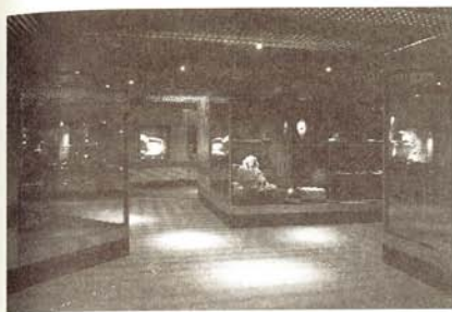
圖8. Jorvik: the Artefact Gallery