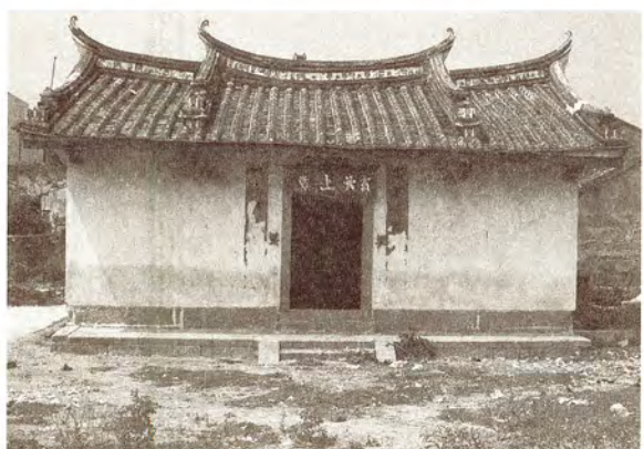
圖5.龍興樓聚落的玄天上帝廟