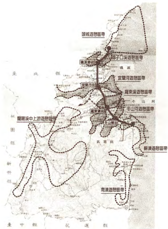
宜蘭縣觀光及修復型產業發展架構圖（轉繪自：宜蘭整體發展觀光計劃通盤檢討，台大城鄉基金會/宜蘭工作室）