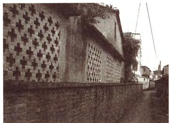
巷弄生活空間一瞥：鄂王里的水井埕院、中正里通往普濟寺的巷道、菜園里的徐家主宅屋側安文土路