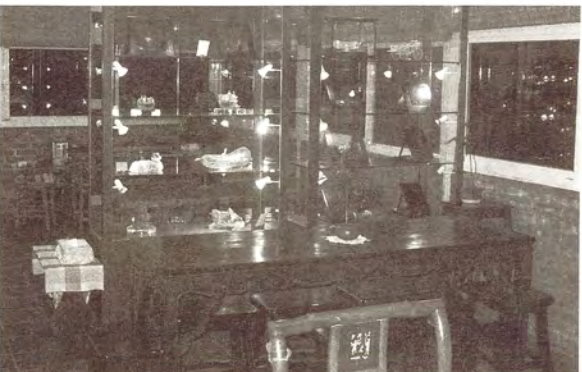
圖6.賣店結合餐飲座椅。