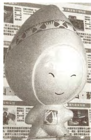
圖6. 蘭博家族代言娃娃。