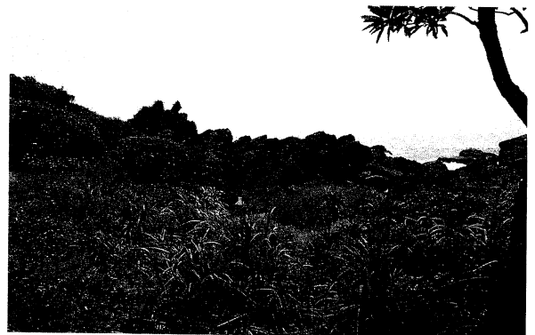
圖12 北關的地形一景