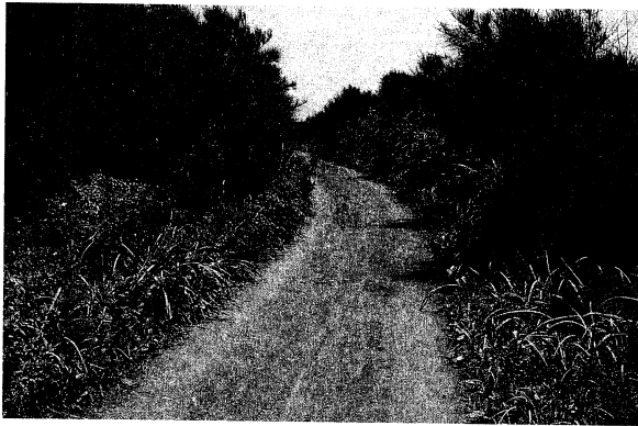
圖9 東港海邊之林投灌叢與木麻黃人工林