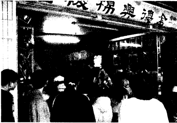
老店類博物館—金德興棉被店