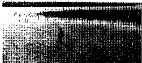
海山漁港的蚵田

（2）風貌地景型展示網絡：將具有良好地景特質地區中之博物館、歷史空間、觀光據點、戶外展示據點等加以串連，發展成具有旅遊服務功能的展示網絡。