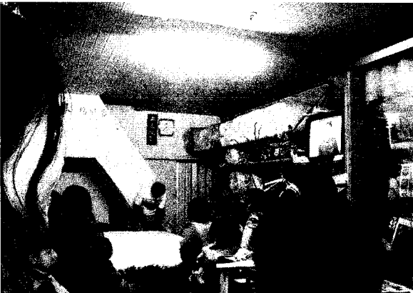
老店類博物館—金德興棉被店