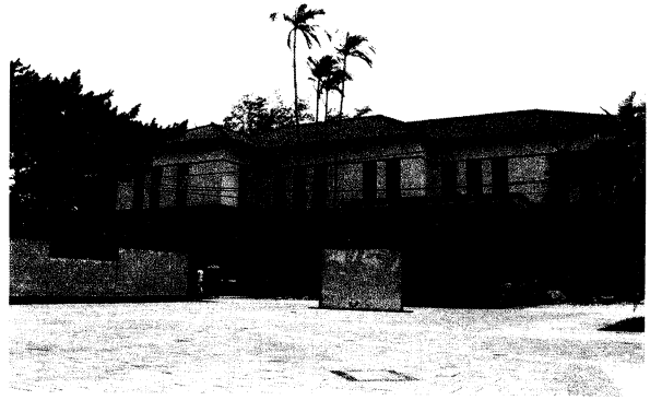
新竹市立玻璃工藝博物館