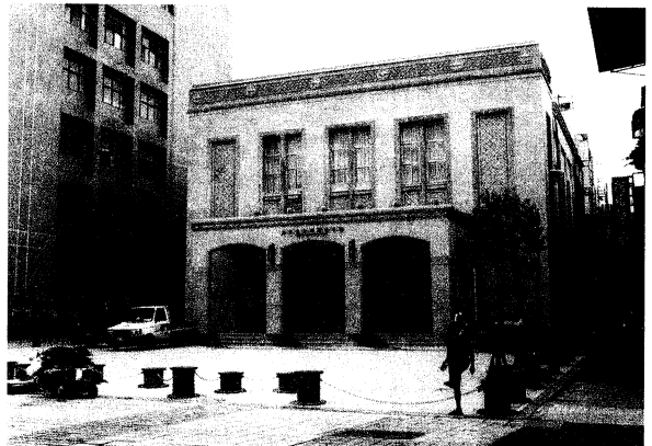
新竹市立影像博物館 清寰管理顧問有限公司提供

(2) 迷你博物館（老店類博物館）：由於因產業性質與類型的差異，使店面擺設或是商業活動呈現不同的面貌，透過這些樣貌的呈現，讓參觀者更能瞭解新竹在地庶民生活與產業發展的歷程與面貌。在這個過程中，店面擺設，呈現的是一種展示活動，而交易行為或是生產活動，又呈現出某種教育意味與推廣的形式，老店空間與整體活動所展現的是一種類博物館的型態。